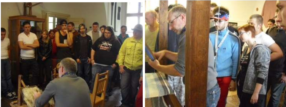
Tvořivá dílna – ukázky starých řemesel – studenti si mohli vyzkoušet sami, jak se předla vlna a spřádala látka.