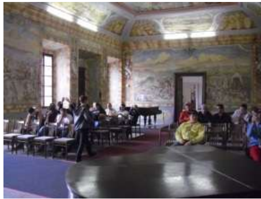
Hrad a muzeum Horažďovice