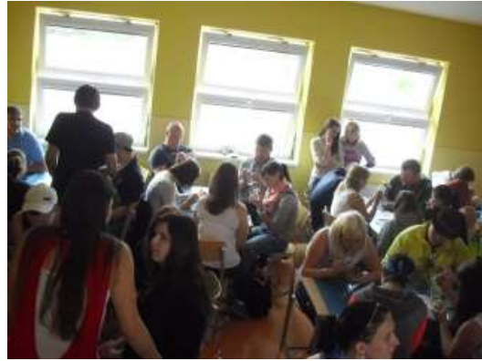
Úvodní workshop – jazyková animace, tvorba suvenýru – malba na sklo