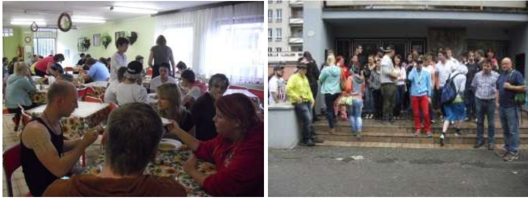
Oběd na domově mládeže v Sušici