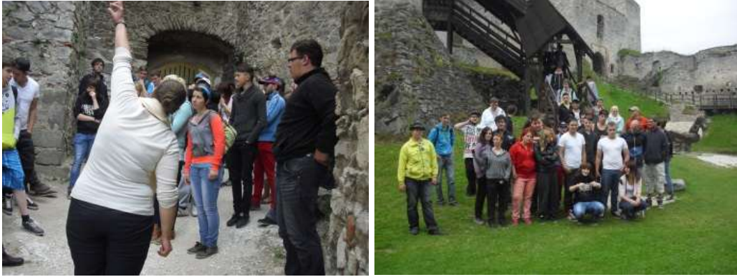
Hrad Rábí s komentářem pro dvě skupiny – česky i německy