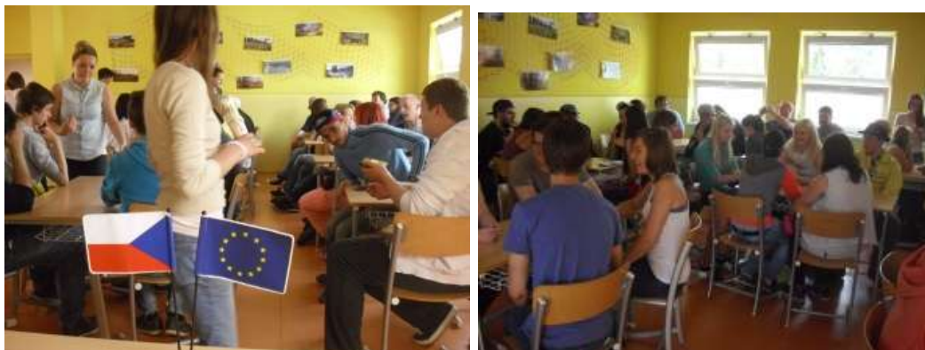
Úvodní seznámení v učebně SOŠ a SOU Sušice