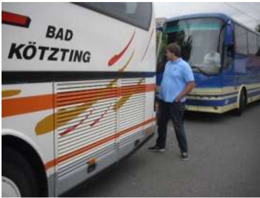
Doprava – autobusy