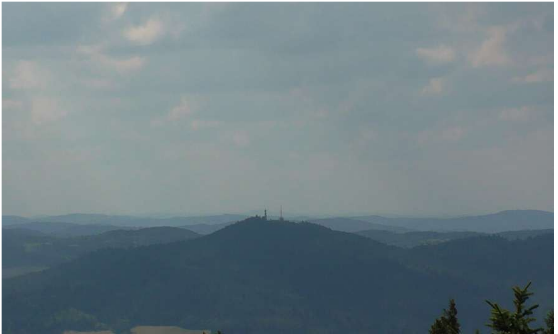
Rozhledna na Svatoboru