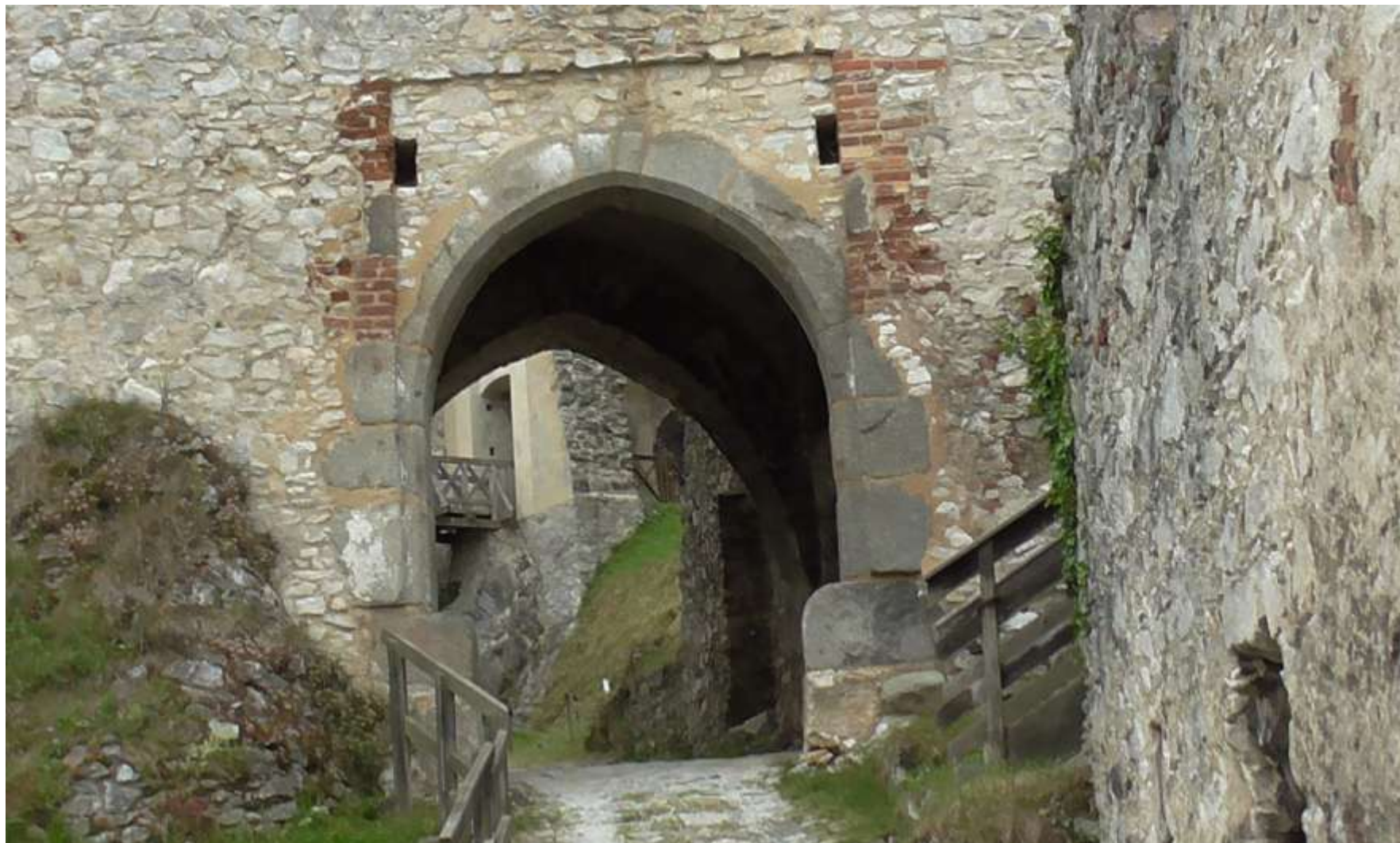
Vstup do hradu