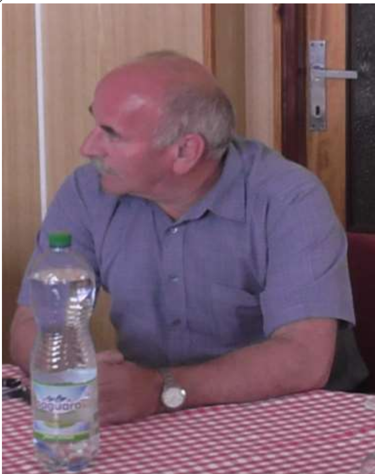
zástupci Krajského úřadu v Plzni, novinář ze Sušických novin.