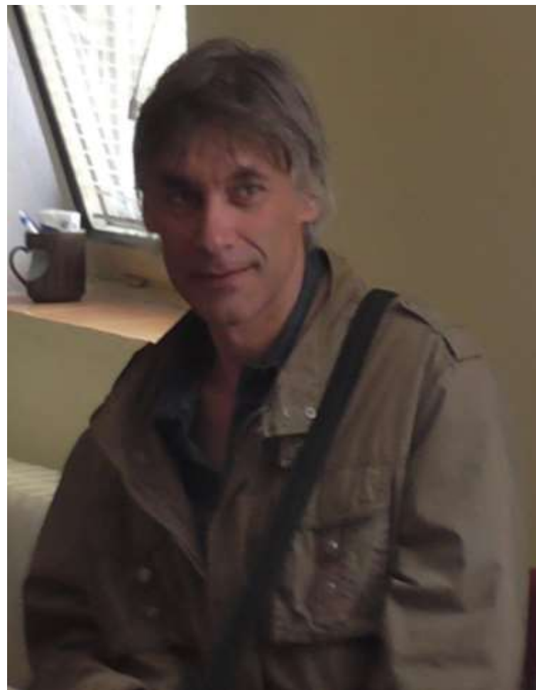
Verträter des Amtes Region Pilzen, Journalist der Zeitung von Sušice und viele Andere.